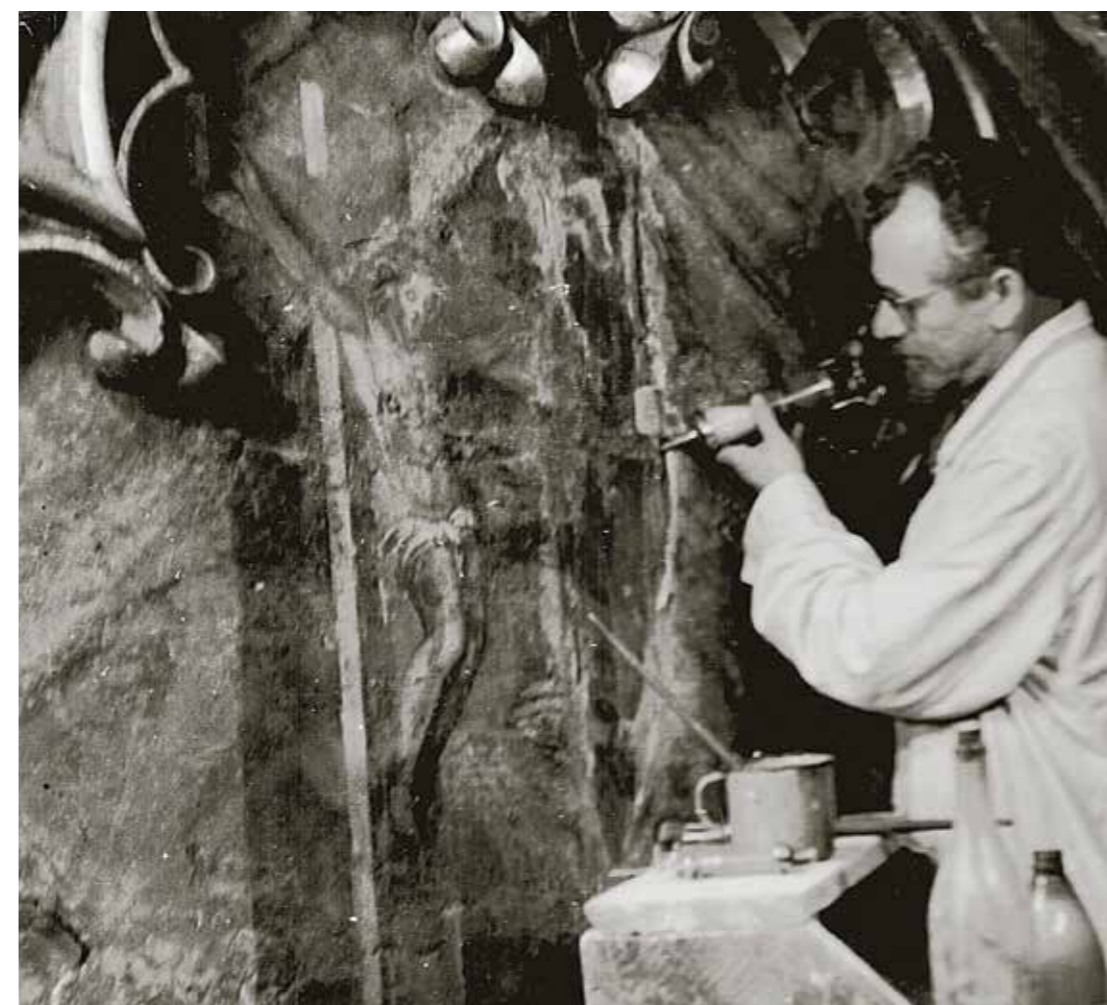
Obr. 6 Katedrála sv. Víta Praha, kaple sv. Václava, nástěnné malby Mistra litoměřického oltáře – restaurování scény Sen krále Ericha, 1965.