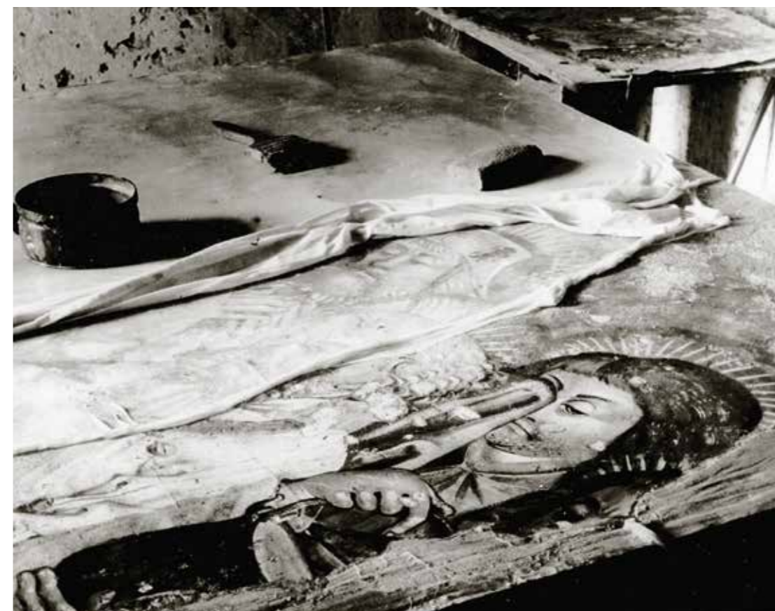
Obr. 4a, b Kostel sv. Václava, Hustopeče, transfer nástěnné malby Smrt Panny Marie, 1962. Archiv Fakulty restaurování, pozůstalost J. Josefíka.