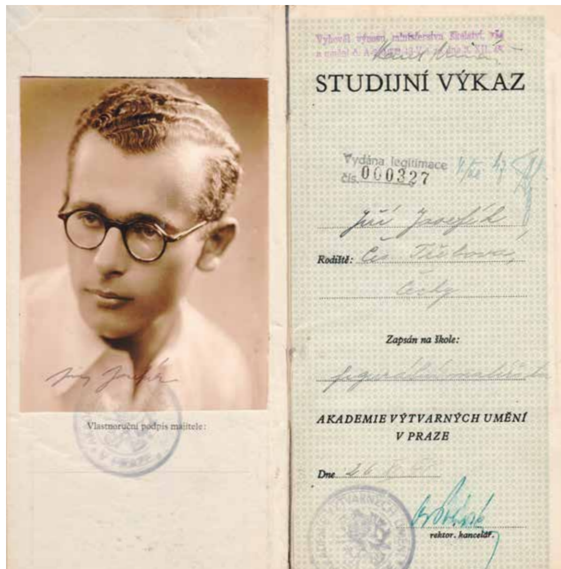
Obr. 1 Index z Akademie výtvarných umění, 1945–1953. Archiv Fakulty restaurování, pozůstalost Jiřího Josefíka.