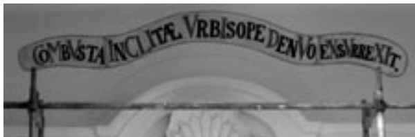
obr. 2, 3

rok vyloučili. Požár v obci podle kroniky vypukl 3. června 1792 a zachvátil kostel, faru, školní budovu a většinu střech v obci. 6 Dospěli jsme k názoru, že správné znění nápisu je s chronogramem datovaným do roku 1794, tj. pouze s jedním písmenem C vpředu, takže bylo toto přebývající písmeno C zaretušováno a nápis byl v této podobě konzervován. 7 Bez obrazového a písemného pramene včetně průzkumu literatury a archiválií by nebylo možné v tomto případě s jistotou určit přesnou dataci nápisu a obhájit jeho opravu na současnou podobu (obr. 3).