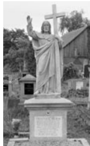
obr. 4, 5

úřadu v Kopidlně restaurátorovi mimochodem nabídnuta „nějaká hlava“, která se ukázala být tou chybějící,