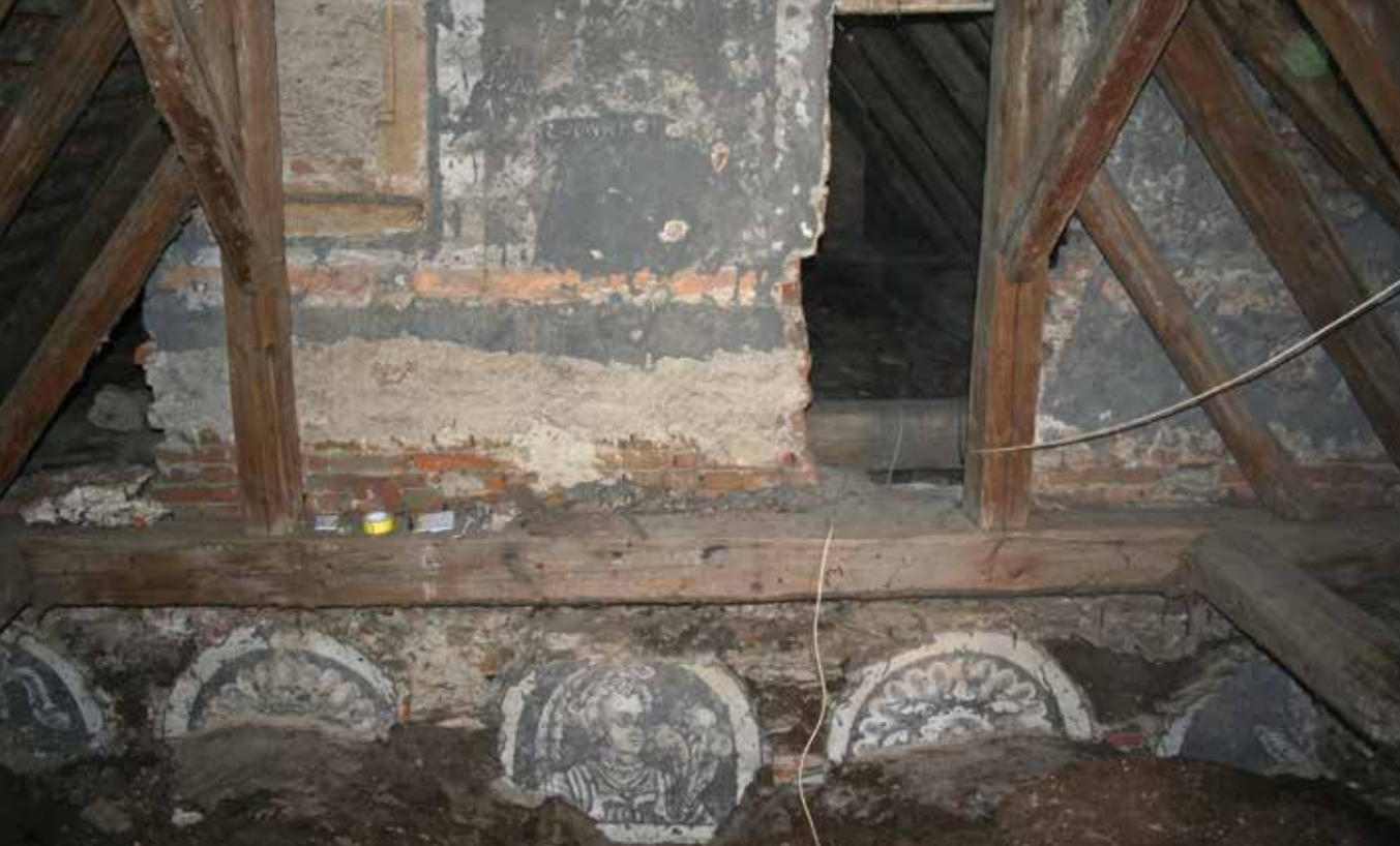
3. Červená Řečice, půda zámku, druhá pol. 16. stol.