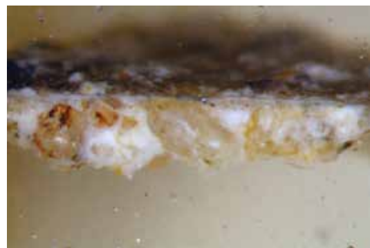
8. Slavonice, fasáda domu čp. 545, druhá pol. 16. stol., vzorek z místa stínu. Intonaco bianco je ztenčeno prokletováním, na povrchu patrné v tenké vrstvě. Foto Zuzana Wichterlová.