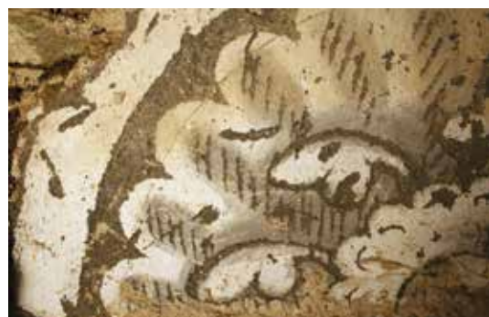
4. Červená Řečice, půda zámku, druhá pol. 16. stol., detail stínování.