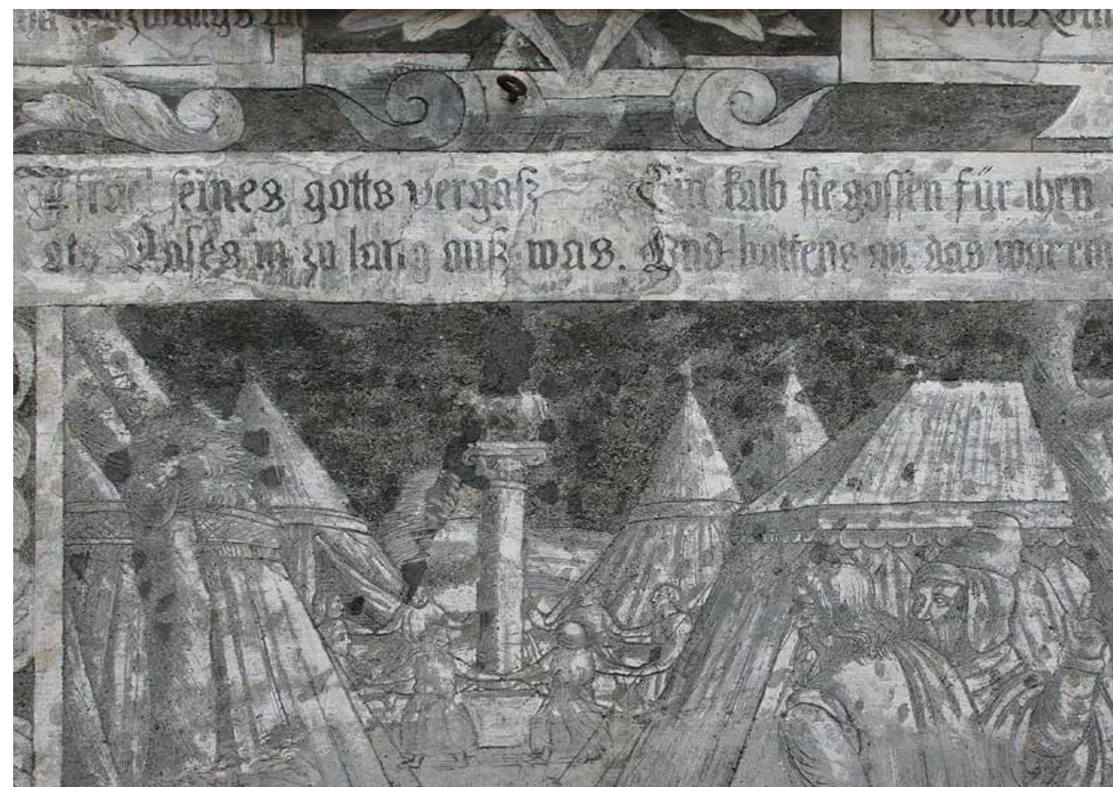
10. Retz, městský dům na náměstí, druhá pol. 16. stol. Jsou zřetelné stopy polotónu – stínování patrně prokletováním.

Malířská technika stínování pomocí štětce byla pozorovaná pouze na jednom z uvedených objektů v Červené Řečici. Na rozdíl od toho byla technika stínování prokletováním pozorována na mnoha objektech v souvisejících lokalitách – nejen v oblasti jižních Čech (Slavonice, Telč), ale i v přilehlých oblastech Rakouska (např. v Retzu). (obr. 9, 10) Technika stínování prokletováním nebyla dosud popsána a tedy ani zkoumána. Je tedy úkolem pro další výzkum zjistit, kde všude se vyskytuje. Technika sgrafita se do našich zemí dostala z Itálie. Je tak otázkou pro další samostatný výzkum, zda technika stínování prokletováním nemá původ přímo tam.