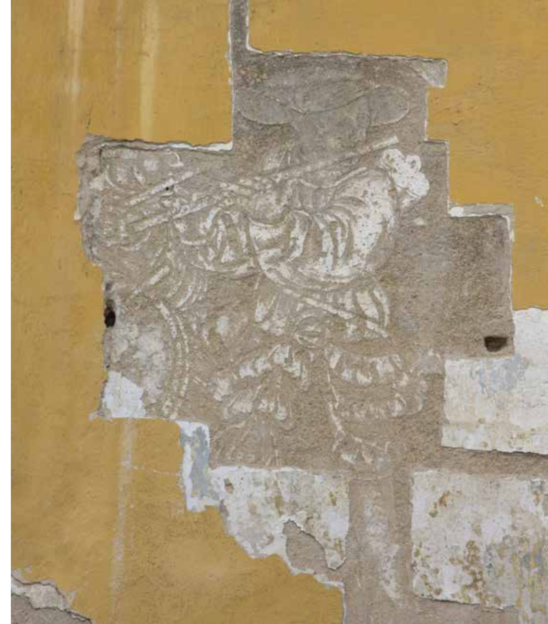
6. Slavonice, fasáda domu čp. 545, druhá pol. 16. stol.

naco colorato (šedé, uhlové), intonaco bianco (vápno bez plniva) a šedá barevná vrstva. (obr. 5) V místech stínů byla tedy nanášena na intonaco bianco štětcem tmavá stínovací barva. Ta se místy zcela promíchala s vrstvou intonaco bianco i intonaco colorato. Samotná rytá kresba a šrafura v místech stínů není nijak poškozená. Z uvedených faktů lze odvodit, jak umělec postupoval. Nejprve nanášel intonaco colorato, následně nanášel intonaco bianco. Pak si připravil rozvrh slabým rytím. Stínování provedl štětcem i s černou barvou. Na některých místech (podle živosti vrstvy intonaco colorato) se mu barva smísila s podkladem, na jiných zůstala na povrchu. Na závěr provedl samotnou rytou kresbu a šrafované stínování. Výsledný obraz tedy má měkké, strukturované, malované stíny.