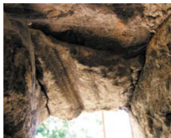
Nedotčený, zcela autentický detail štěrbin nad portálem branky pro pěší, dokládající funkci padacího mostu a starobylost památky.

Odkrytá úprava podstatné části exteriéru jediné úplně dochované hradní budovy poničeného areálu hradu Lipý, její originální a dosud velmi autentická výzdoba nepředstavuje, s ohledem k absenci náročnější ornamentální, florální či figurální kompozice, umělecky výjimečný, špičkový dobový projev. Avšak o to více fasáda vykazuje i při elementární jednoduchosti rozvrhu a „výtvarné lapidárnosti“ velkou působivost svojí mimořádnou výpovědní