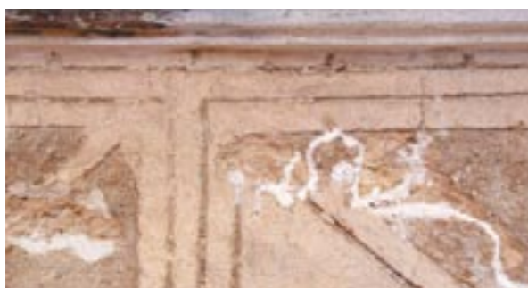
Detail stavu renesančního sgrafita v průběhu záchranného zajištění (foto Václav Girs, 2005)