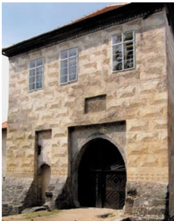
Branská věž hradu Lipý po obnově a restaurování sgrafitové výzdoby