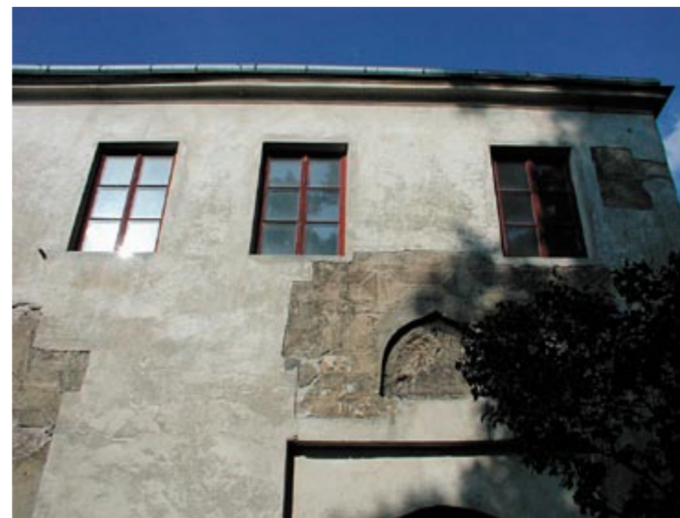
Výsek hlavního průčelí branské věže dokládá neutěšený stav památky a chátrání odkryté sgrafitové výzdoby před obnovou (foto Václav Gírsa, 2004)

ných degradovaných omítkových vrstev z jednotlivých průčelí, včetně korekce okenních výplní. Hlavním důvodem odstranění nevhodných omítek byla především nutnost záchranu ohrožených ploch sgrafitové výzdoby, jejichž výskyt byl patrný v místech analytických sond nebo v plochách odpadlé krycí omítkové vrstvy. Rozsah zachovaných ploch se potvrdil v provedených sondách na jižním, východním a severním průčelí, kde se výzdoba dochovala ve velkém rozsahu a odkryv sgrafit umožnil objev ploch s pozoruhodným rozvrhem výzdoby, zajímavými detaily i rukopisem, s množstvím nových informací o podobě i původním fungování starobylé stavby.