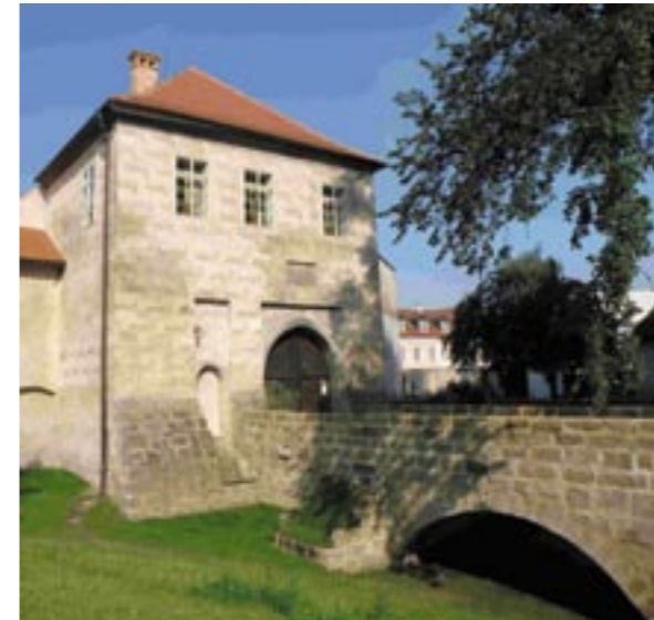
Hlavní vstup do hradu Lipý. Celkový pohled na branskou věž po obnově přístupového mostu (foto Miloslav Hanzl, 2010)

Václav Girsá, Miloslav Hanzl, Dagmar Michoinová