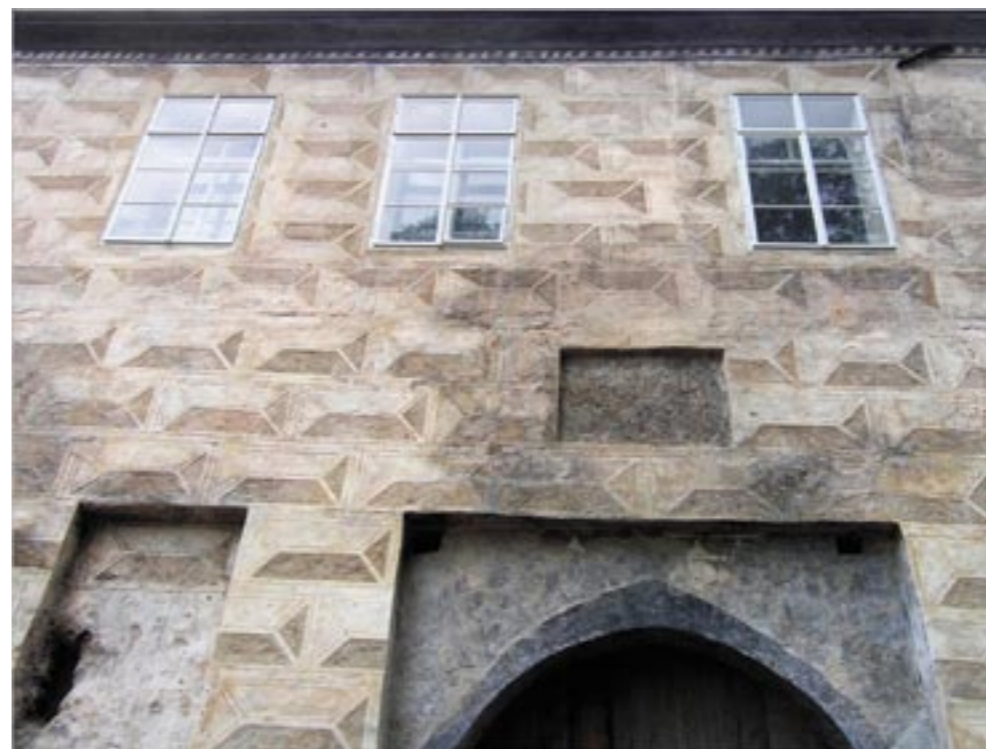
Výsek hlavního průčelí po restarování sgrafitové výzdoby. Porovnáním s plánem průčelí možno ověřit převažující rozsah originální výzdoby

Odhalením plochy průčelí vlevo od brány došlo k pozoruhodnému nálezu zazděné mělké niky se zrušenou brankou pro pěší i následně další de-