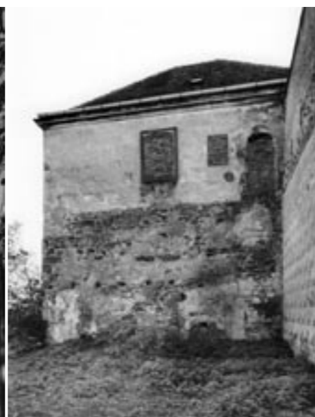
Severní průčelí branské věže před obnovou (foto L. Bezděk, 2004)