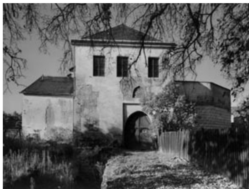
Hlavní průčelí branské věže hradu Lipý před obnovou (foto Ladislav Bezděk, 2004)

V případě branské věže byla stanovena koncepce rehabilitace objektu s novým využitím v návaznosti na nezbytné zkultivování areálu jako celku, včetně blízkého okolí. Koncepce rehabilitace exteriéru věže byla podpořena i výsledky průzkumů a závažností jejich zjištění. 6 Bylo zvoleno sejmутí druhot-