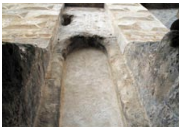
Výsek hlavního průčelí s portálem branky pro pěší. Nejedná se o rekonstrukci, ale o mimořádně působivou autentickou situaci vzácně dochované partie se středověkými detaily, omítkou a renesanční sgrafitovou výzdobou (foto Václav Girs, 2006).