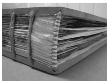
Kapitálek zpevněný pruhem pergamenu.