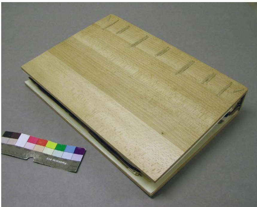
Přední deska po restaurování.