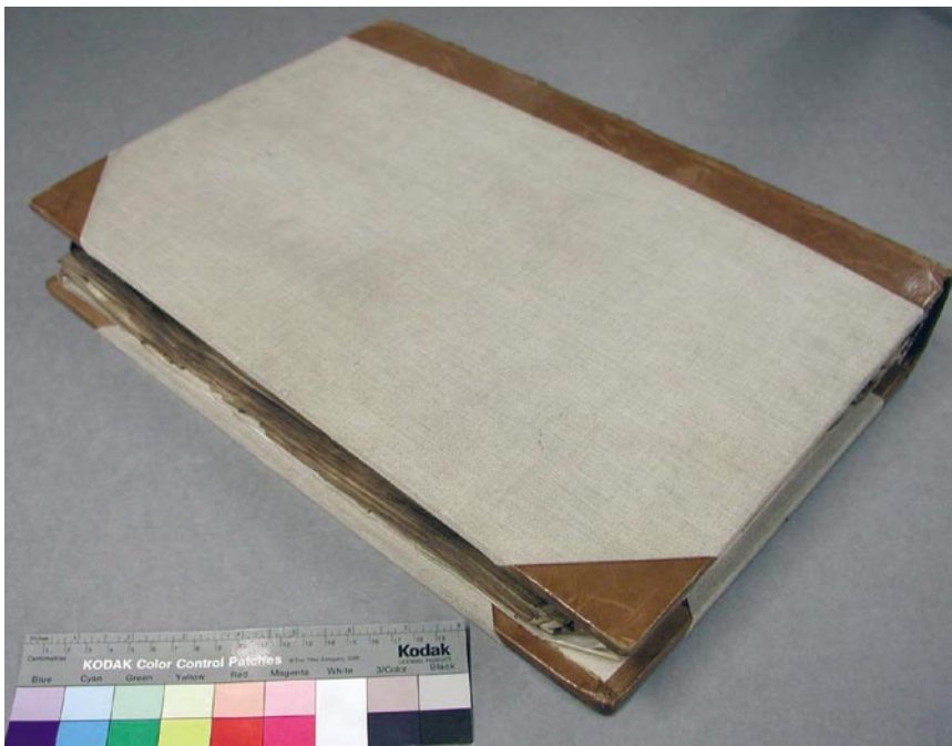
Přední deska před restaurováním.