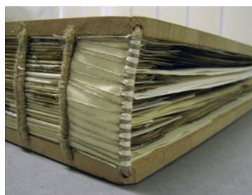
Kapitálek zpevněný pruhem pergamenu.