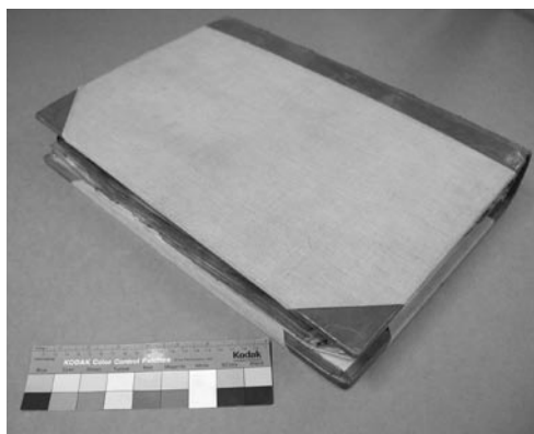
Přední deska před restaurováním.

SZIRMAI, J. A.: The Archeology of Medieval Bookbinding , Ashgate 1999.