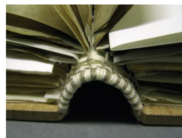
Otevření vazby na 180°.