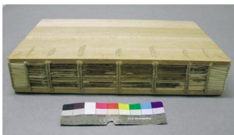
Hřbet po restaurování.