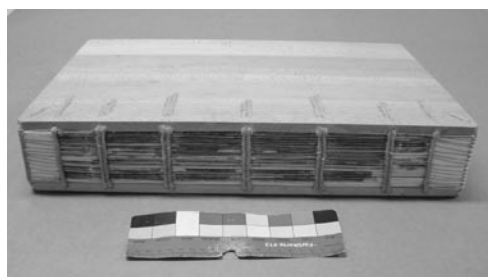
Hřbet po restaurování.