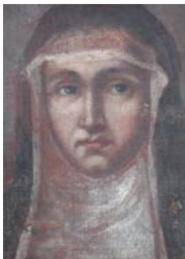
Sv. Alžběta, během odstraňování přemaleb, na pozadí a šatu původní malba, ve tváři přemalba