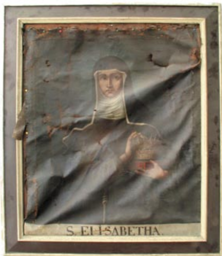
Sv. Alžběta, celek, stav před restaurováním