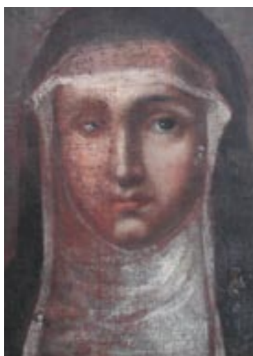
Sv. Alžběta, během odstraňování přemaleb z tváře, vlevo původní poškozená malba, vpravo přemalba