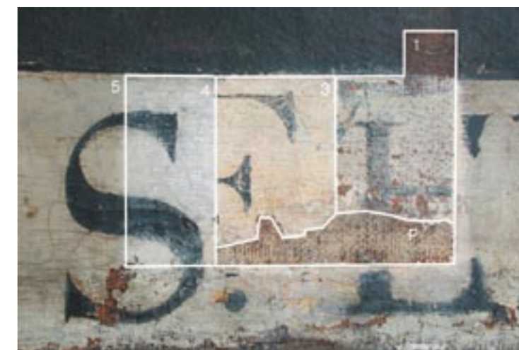
Sv. Alžběta, nápisový pás, stratigrafická sonda 1 - původní malba s původním textem 3 - první přemalba 3 - druhá přemalba 4 - druhá přemalba s vrstvou laku a nečistotami P - Iněné plátno

rované portréty sbírky bylo rozhodnuto přistoupit k sejmutí obou přemaleb a zrestaurování původní barevné vrstvy. Toto rozhodnutí bylo přijato na základě diskuze všech zúčastněných stran (investor, restaurátor, památkář, technolog) a s plným vědomím skutečnosti, že zatímco vrchní celoplošná přemalba je dochována v relativně dobrém kompaktním stavu, původní malba vykazuje značná lokální poškození, která mohou být během odkrývání ještě prohloubena. Dále zúčastněné strany konstatovaly, že výtvarný i estetický účinek odkryté malby bude na míle vzdálený tomu, jaký měl obraz posledních cca 150 let a na který byl investor i návštěvníci kláštera zvyklí.