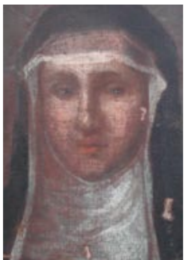
Sv. Alžběta, stav po odstraňování přemaleb