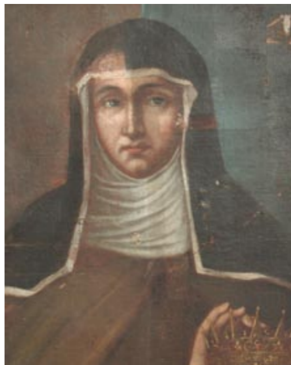
Sv. Alžběta, během odstraňování přemaleb, vlevo původní malba (kromě obličeje), vpravo přemalba