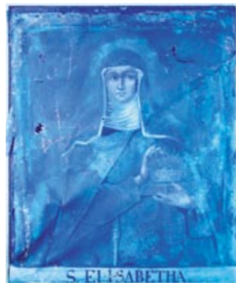
Sv. Alžběta, celek, stav před restaurováním, UV foto