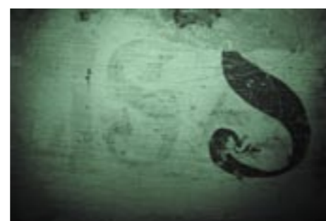
Sv. Alžběta, nápisový pás, foto v IČ, vlevo patrný starší nápis pod vrchní přemalbou

přemalována dvěma vrstvami přemaleb. První, lokální přemalba se omezila na oblast závoje, inkarnátů a spodního nápisového pásu. Pozdější druhá přemalba už pokrývala celý povrch plátna a svým charakterem odpovídala přemalbám, nalezeným při minulém restaurování na ostatních obrazech, a byla tedy analogicky datována do druhé poloviny 19. století.