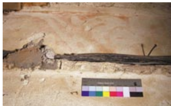
Obr. 5: Pozůstatek původní omítky s fragmentem malovaného vlysu zachovaný pod krovem novější (pravé) arkády

Přestože v průběhu obnovy byly odstraněny novodobé omítky a odhaleny byly všechny zachované plochy renesanční omítky, původní bohatou