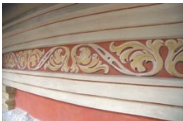
Obr. 10: Vlys pod římsou přízemí po rekonstrukci malby