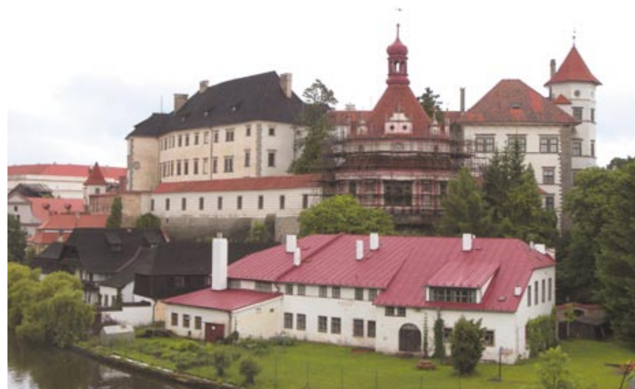
Obr. 2: Pohled na zámek s Rondelem přes řeku Nežárku v průběhu rekonstrukce, jaro 2012

Další oprava, projektovaná v rámci generální rekonstrukce zámku v 80. letech, byla dokončena až v roce 1994, kdy Rondel získal růžovo-bílou barevnost, ze které nelogicky – ale v souladu s dobou a částečně i dnešní praxí – vystupovaly šedé kamen-