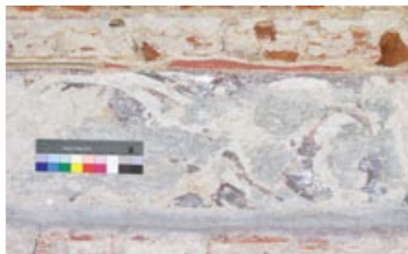
Obr. 6: Fragment malovaného vlysu pod cementovým nátěrem zachovaný na vnější straně Rondelu