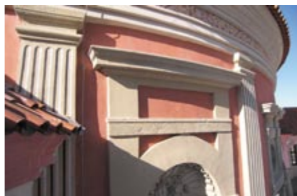
Obr. 12: Část přízemní části po rekonstrukci. Malovaná kanelura na pilastrech, vlys pod římsou a lazurně patinované kamenné prvky (hlavice pilastrů, římsy nad nikou)