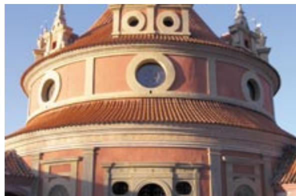
Obr. 13: Střední část Rondelu při pohledu ze zámecké zahrady, stav po rekonstrukci, březen 2013