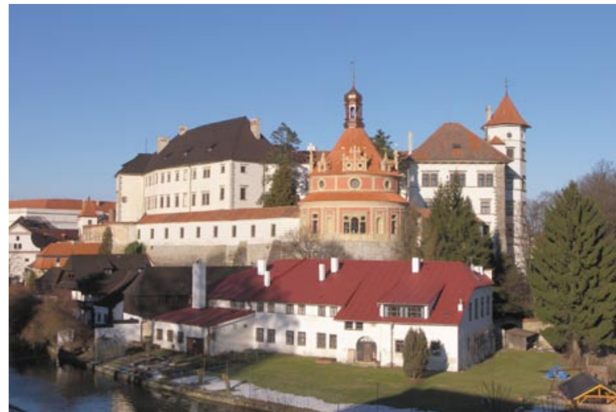
Obr. 14: Celkový pohled na zámek s Rondelem přes řeku Nežárku, stav po rekonstrukci v březnu 2013

(podobný jednoduššímu motivu v malovaném kladí na fasádách Kratochvíle; obr. 10) a kanelování pilastrů v přízemí (obr. 12). Původně nenatírané kamenné prvky, jejichž barva zřejmě korespondovala s režnou barvou tektonických článků (ztmavnutí je nutné kromě dlouhého působení povětrnosti přičíst i moderním konzervačním zásahům), dostaly lazurní zesvětlovací nátěr, aby se sice opticky zapojily do tektonického systému, ale jejich odlišný materiál byl stále zřejmý (obr. 12).