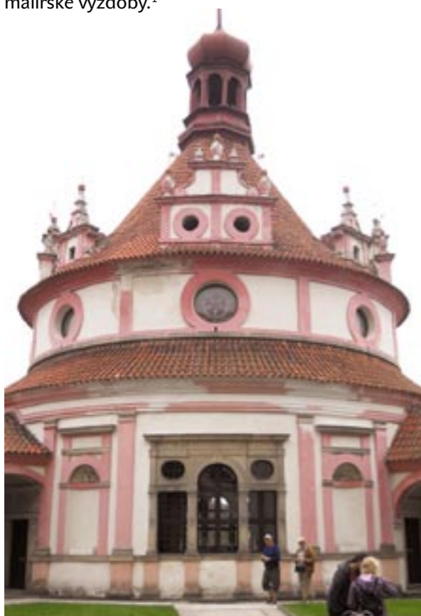
Obr. 1: Státní hrad a zámek Jindřichův Hradec, hudební pavilon Rondel. Pohled na Rondel ze zámecké zahrady před rekonstrukcí (2010). V ahistorickém barevném řešení z opravy v r. 1994 se nelogicky uplatňují kamenné prvky

Hudební pavilon Rondel v zahradě jindřichohradeckého zámku je jednou z nejhodnotnějších staveb pozdní renesance u nás. Poslední velká oprava na přelomu 80. a 90. let 20. století se soustředila především na opravu bohaté štukové výzdoby interiéru, exteriéru vtiskla technicky i esteticky nepříliš zdařilou podobu. Během obnovy pláště Rondelu v roce 2012 se podařilo získat informace o dosud téměř neznámé nejstarší podobě fasád pavilonu a rekonstruovat alespoň část jejich původní bohaté malířské výzdoby. 1