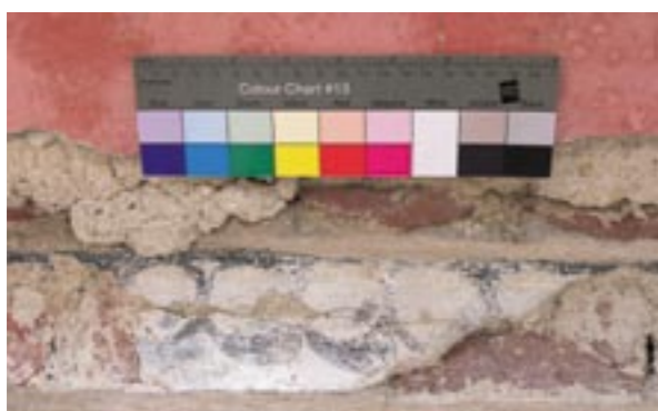
Obr. 4: Fragment malovaného perlovce na korunní římsě tamburu

Teprve druhá vrstva omítky, jemnozrná a kletovaná, sloužila jako podklad pro Widmanovu malbu. Podle archivní zprávy Widman maloval v roce 1598 „4 velké a 4 malé štíty, dole pod krancem pak dokola 16 velkých obrazů olejovými barvami s fasorováním a ozdobami. Kolem římsy až ke gruntu pak vodovými barvami a „špice“ na chodbě (klenební výseče a lunety v arkádové chodbě).“ 45