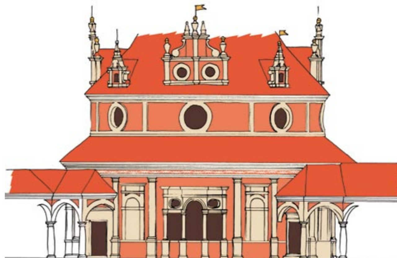
Obr. 8: První návrh barevného řešení Rondelu bez detailního řešení římsy a kanelur na pilastrech v přízemí, s později změněnou podobou soklové části

Na základě těchto zjištění vznikl v průběhu prací návrh nové barevnosti Rondelu (obr. 8). Detaily návrhu se měnily až v průběhu prací a zkoušek přímo na fasádách (sokl). Na základě nálezů jsme navrhli červené (terakotové) základní plochy, světlou (režnou) barvu tektonických článků (která korespondovala s původně světlejší barvou nenatíraného kamene) a lomenou bílou barvu obou hlavních říms. Výsledkem není návrat k historickému stavu, jehož důležitou část neznáme (dekor a obrazy v základních plochách), ale současná interpretace nálezů s využitím základního barevného schématu původní podoby (základní červená barva v plochách omítek, ze kterých vystupují světlejší tektonické články) a jejich doložených výzdobných prvků (římsy, vlysy, pilastry).