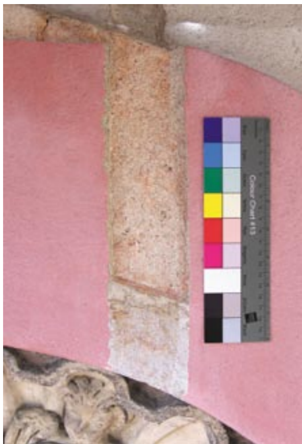
Obr. 3: Omítka s hrubým povrchem a červeným nátěrem s mramorováním z nejstarší, provizorní opravy Rondelu (sonda nad nikou v zahradním průčelí)