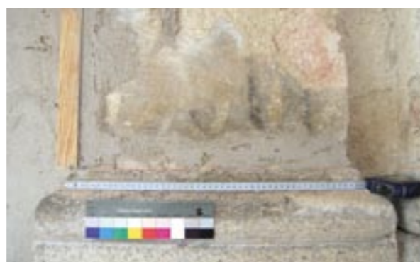
Obr. 7: Pozůstatek původní omítky s fragmentem malované kanelury zachovaný u patky pilastru na zahradní straně Rondelu

výzdobu je z těchto zlomků možné jen odhadovat. Vzhledem k fragmentárnosti dochovaných částí a míře degradace jejich povrchu bylo možné spolehlivě dešifrovat jen některé opakující se dekorativní motivy na architektonických člancích (obr. 4–7). Důležitou roli v interpretaci nálezů sehrály části omítky, dochované v prostoru krovu novějšího, pravého křídla arkád, přistavěného k Rondelu v 17. století. Na později už nijak neupravované omítce se zachovala část dekoru ve vlysu pod římsou i zbytky barevnosti v plochách pod ním (obr. 5). Archivně