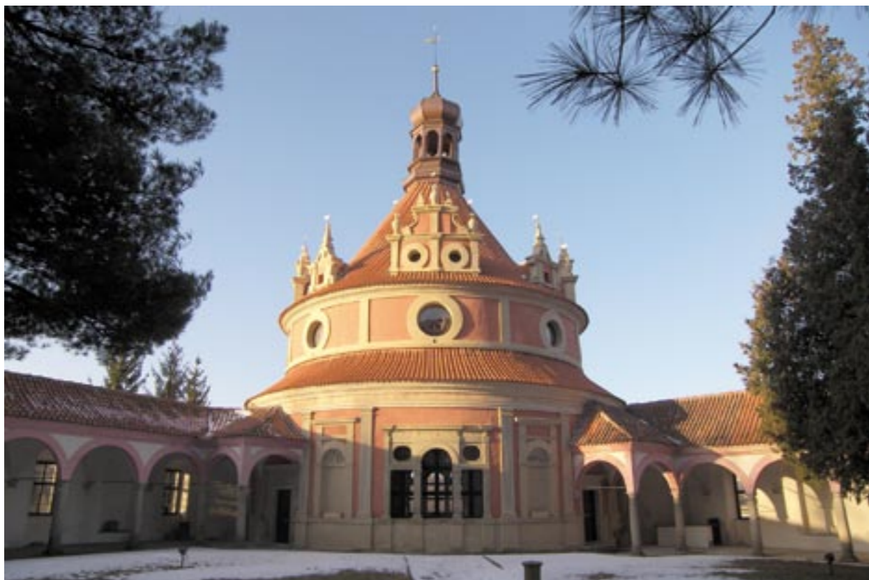
Obr. 9: Celkový pohled na Rondel ze zámecké zahrady po rekonstrukci, březen 2013