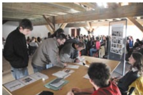
Konference na zámku v Litomyšli v roce 2010.

Sdružení je provozovatelem internetových stránek www.arte-fakt.cz , které slouží jako informační server pro odbornou i laickou veřejnost. Stránky mj. monitorují aktuální dění v oboru, upozorňují na zajímavá témata, nabízejí možnost diskuse, přinášejí seznam odborných akcí. Kromě toho lze na těchto stránkách najít také více informací o činnosti a aktivitách našeho sdružení.