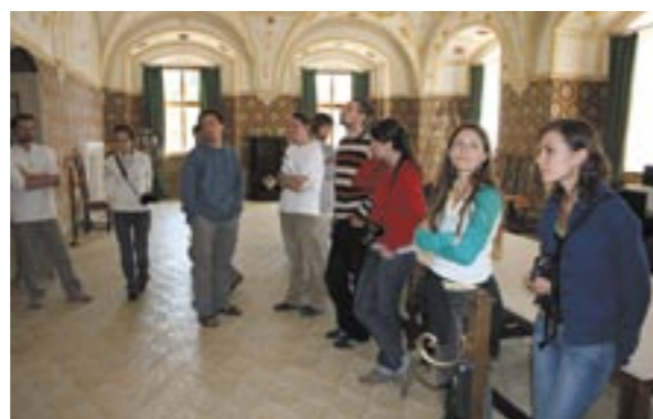
Prohlídka restaurátorských prací na zámku Kratochvíle u Netolic v roce 2008.