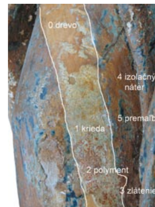
Obr. 7. Madona z Bobrovca, sonda stehno.