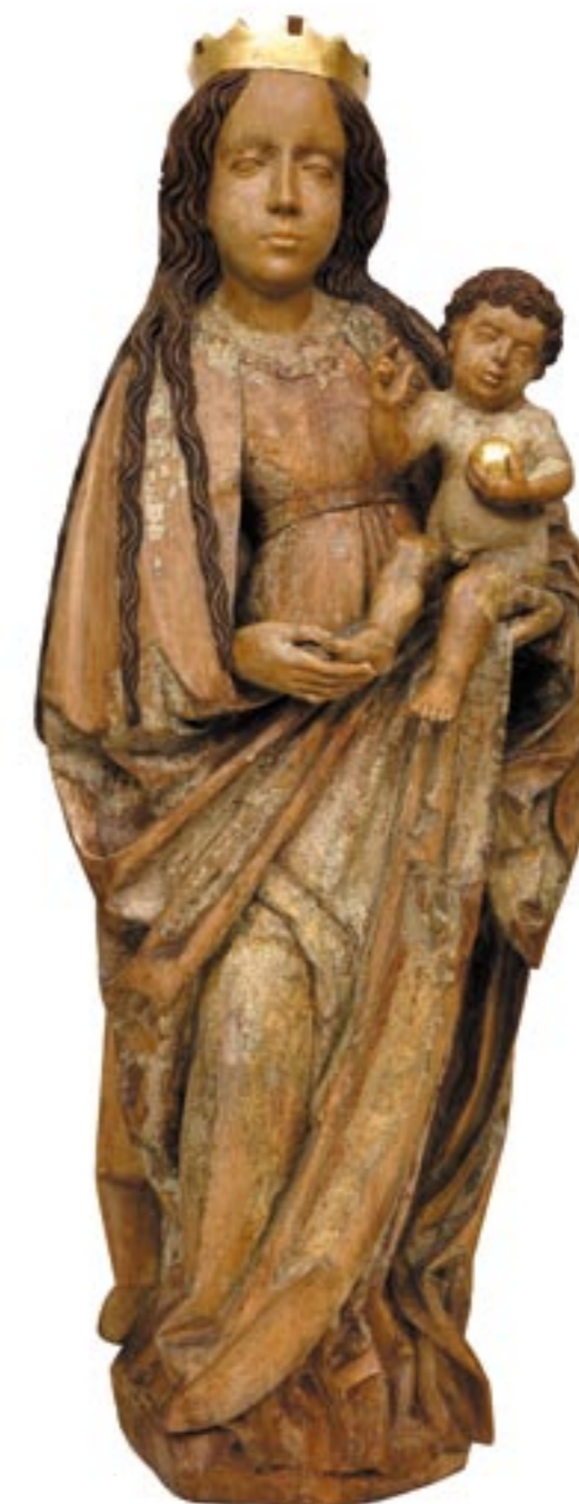
Obr. 3. Madona z Bobrovca, po reštaurovaní.

vým kusom dreva. Najzaujímavejším nálezom je vertikálny otvor veľkosti mince prechádzajúci za postavou Ježiška a vyúsťujúci dole zo zadnej strany drapérie pri tzv. uchu. V otvore sú čitateľné vydraté lôžka po poťahovaní špagátu – lanka. Účel ťažko domysliť aj keď v spišskej skulptúre 14. storočia: Madona z Ruskinoviec a Madona z Podolínce sa podobné otvory využívali na pohybovanie hlavou Ježiška vyrezanou na čape a zapustenou v jeho tele. Naša socha v súčasnosti