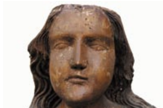
Obr. 9. Madona z Bobrovca, hlava pred reštaurovaním.