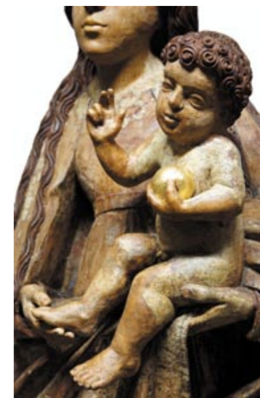
Obr. 14. Madona z Bobrovca, Ježiško po reštaurovaní.