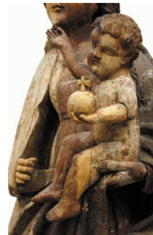
Obr. 12. Madona z Bobrovca, Ježiško polovičné čistenie.