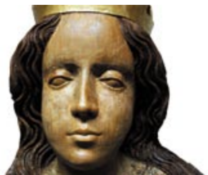
Obr. 10. Madona z Bobrovca, hlava po reštaurovaní.

ne doplnenie (7% želatína + bolonská krieda). Po imitácii jej štruktúry sa realizovala lazúrna retuš akvarelom (Maimeri). Korpus koruny a guľa boli vyzlátené plátkovým zlatom na mixtion (Kölner 3 h). Intenzita, respektíve nepredratie zlátenia súvisela zo snahou administrátora ako vlastníka umiestniť našu madonu centrálne do hlavného oltára. Na retuš rekonštruovaných sochárskych partií zo syntetickej živice bol použitý suchý pigment pojený bieleným šelakom. Na záver ochrana skulptúry pozostávala z fixácie lazúrou včelieho vosku rozpusteného v toluéne (1 : 20). Rozsah a forma rekonštrukcie s reštaurovaním bola akceptovateľná, keď zoberieme do úvahy že ide naďalej o objekt liturgického významu a nielen o doklad muzeálneho charakteru.