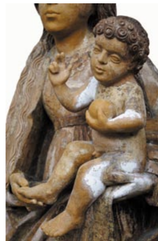
Obr. 13. Madona z Bobrovca, Ježiško rekonštrukcia. Foto Bedrich Hoffstädter.