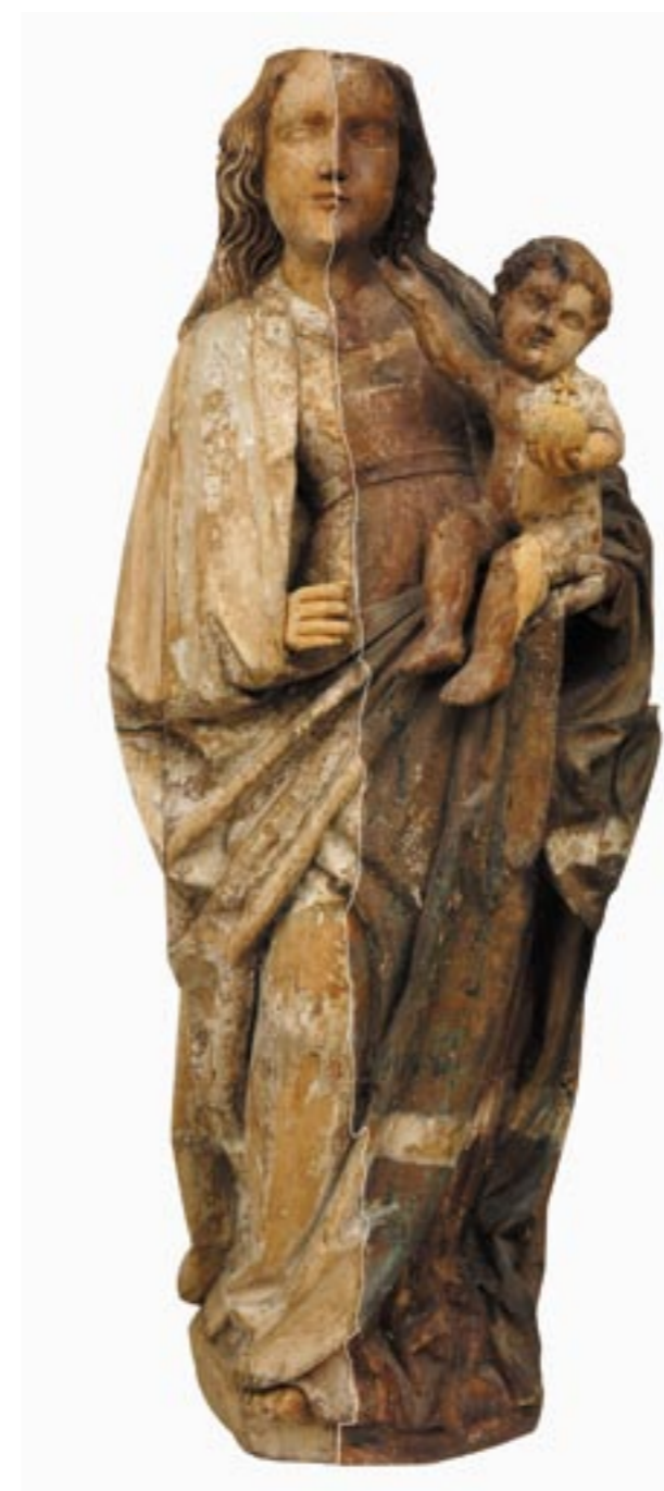
Obr. 2. Madona z Bobrovca, polovičné odstraňovanie sekundárnych vrstiev.

vým kusom dreva. Najzaujímavejším nálezom je vertikálny otvor veľkosti mince prechádzajúci za postavou Ježiška a vyúsťujúci dole zo zadnej strany drapérie pri tzv. uchu. V otvore sú čitateľné vydraté lôžka po poťahovaní špagátu – lanka. Účel ťažko domysliť aj keď v spišskej skulptúre 14. storočia: Madona z Ruskinoviec a Madona z Podolínce sa podobné otvory využívali na pohybovanie hlavou Ježiška vyrezanou na čape a zapustenou v jeho tele. Naša socha v súčasnosti