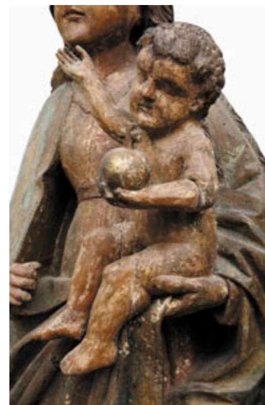
Obr. 11. Madona z Bobrovca, Ježiško pred reštaurovaním.