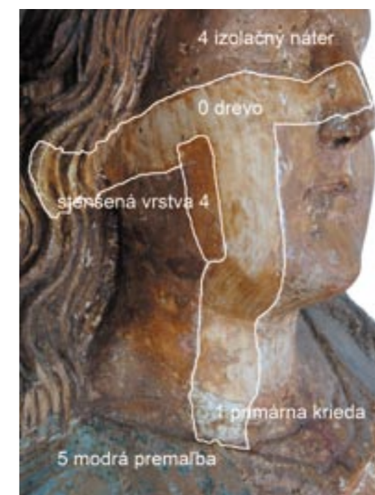
Obr. 8. Madona z Bobrovca, sonda tvár.