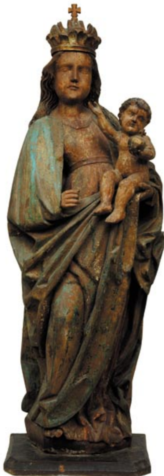
Obr. 1. Madona z Bobrovca, pred reštaurovaním.

úlohu. S osadením nového oltára Ukrižovania do kaplnky bol osud barokovo upravenej gotickej skulptúry Madony s Ježiškom viac menej spečatený. Zostala jediným dokladom zo zaniknutého pôvodného gotického oltára. Rez sochy v CT poukázal na niekoľko zaujímavých momentov. Jadro sochy sa nachádza vpredu centimeter od okraja hrudníka Márie a nie na chrbte, kde býva štandardne odstránené vysekaním do korytka. Ľavá časť drapérie v hrúbke cca 3 cm je nadstavená no-