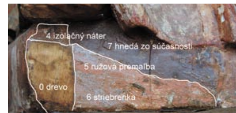
Obr. 6. Madona z Bobrovca, sonda sokel.