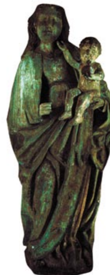
Obr. 4. Madona z Bobrovca, UV luminiscencia po odstrojení.